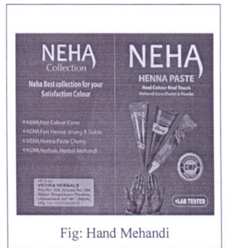
Fig: Hand Mehandi

“Neha Hand Mehandi is made using the finest handpicked Henna leaves. A number of wonderful and therapeutic ingredients are added to it, making it the perfect natural colouring agent. It is comparable to a natural and painless form of temporary tattoo, as it imparts a deep colour and an elegant appearance to designs drawn on your hands and feet. The rich colour is a result of the quality of the Henna leaves, and has been appreciated by customers the world over.”